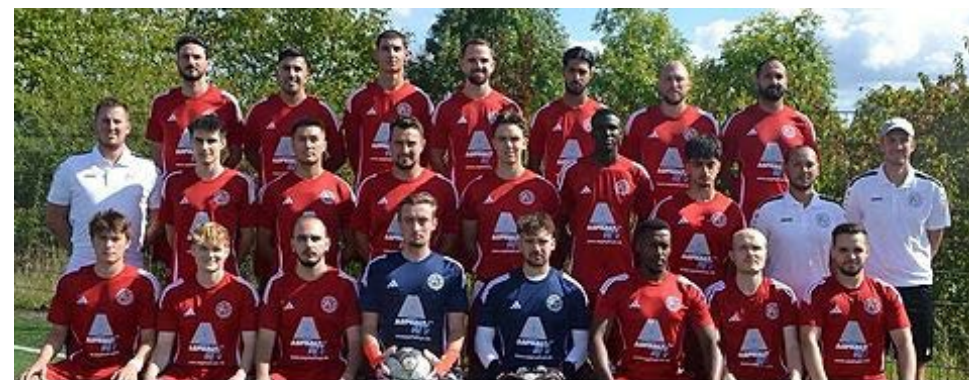
FC ROT WEISS LESSENICH 1951 e.V. 1.MANNSCHAFT SAISON 25/26