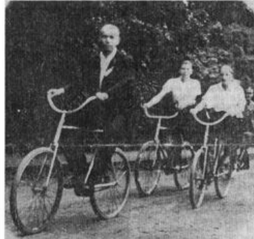
Neben den sportlichen Wettkämpfen spielten die geselligen Veranstaltungen, wie etwa ausgedehnte Radwanderungen durch die Umgebung, eine große Rolle im Vereinsleben der „Staubwolke“.

Im Sommer 1951 gründeten fußballbegeisterte junge Männer aus Lessenich den Verein FC Rot-Weiss Lessenich. Kurz nach der Gründung wurde der Verein in den Fußball-Verband Mittelrhein aufgenommen und nahm am Spielbetrieb im Kreis Bonn teil.